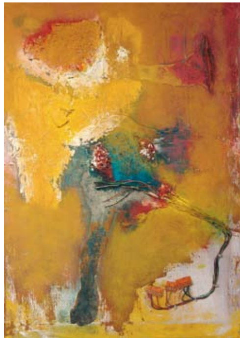
P-05 - 2009 - Peinture sur toile et collage - huile/circuits imprimés/latex - 65*50CM - Collection personnelle de l'artiste