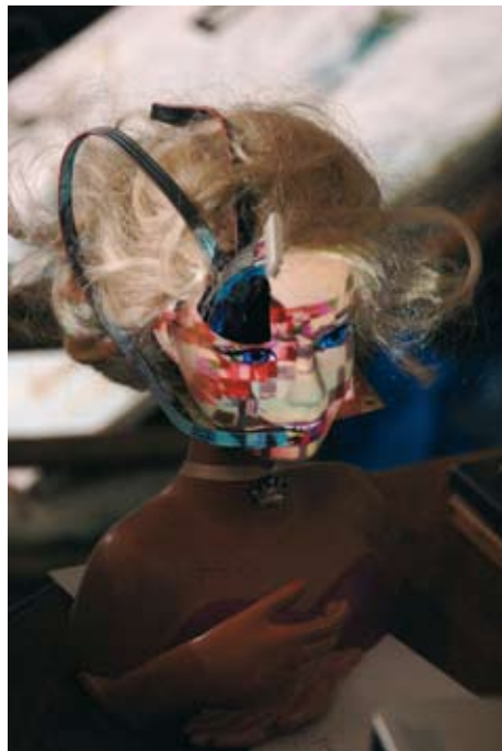
Cylon - 2009 - Buste de poupée barbie en plastique et vidéo projection- plastique/circuits/vidéo projecteur - Collection personnelle de l'artiste