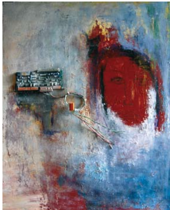
P-06 - 2009 - Peinture sur toile et collage - huile/circuits imprimés/encre de chine - Collection personnelle de l'artiste