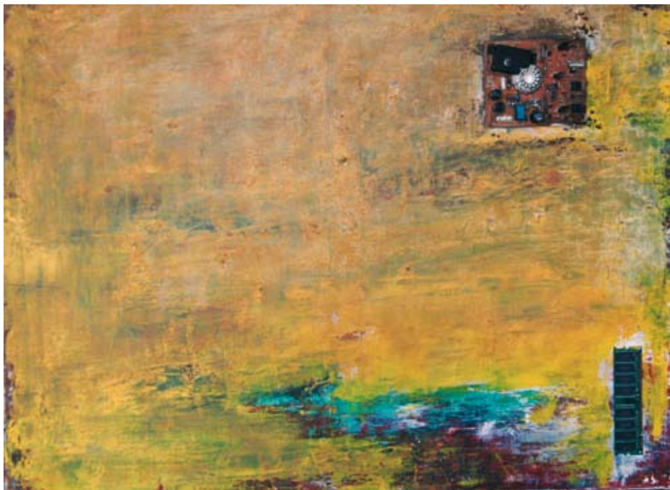
P-01 - 2009 - Peinture sur toile et collage - huile et circuits imprimés - 60CM*81CM - Collection personnelle de l'artiste