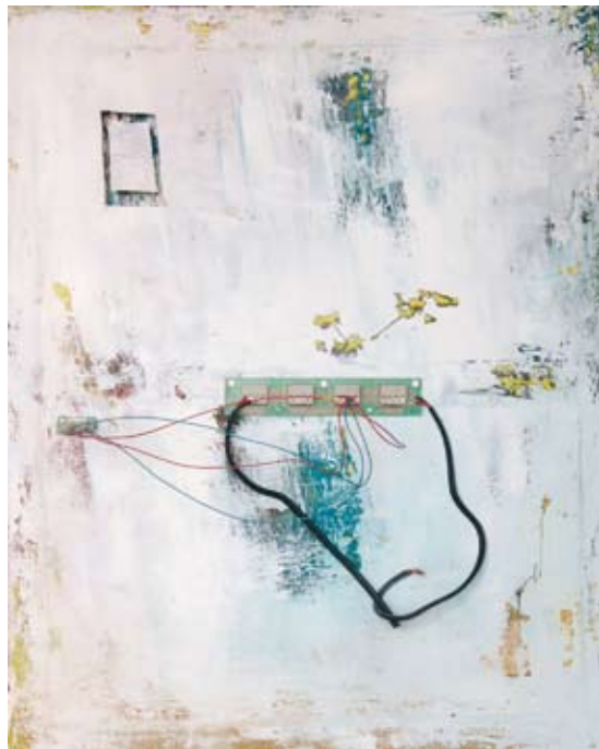
P-04 - 2009 - Peinture sur toile, collage et clouage - huile/circuits imprimés/encre de chine - Collection personnelle de l'artiste