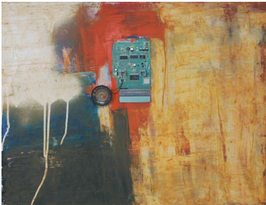
P-03 - 2008 - Peinture sur toile et collage - huile/circuits imprimés/acrylique - 61*50CM - Collection personnelle de l'artiste