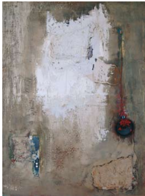
Mur - 2008-2009 - Peinture sur toile et collage - huile/circuits imprimés/latex - 60*81CM - Collection personnelle de l'artiste